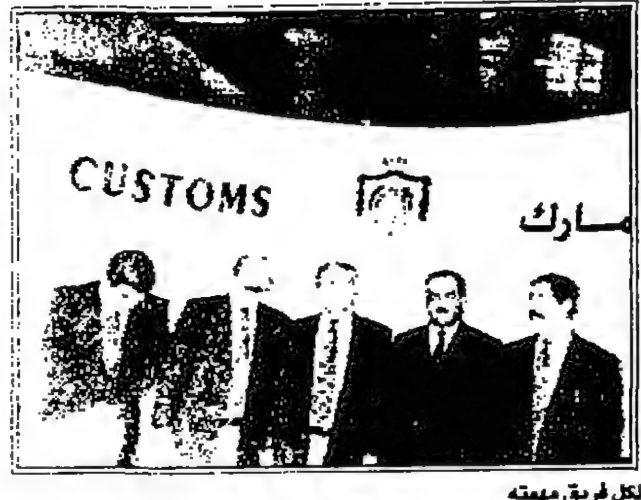
لقد فريق مهمته